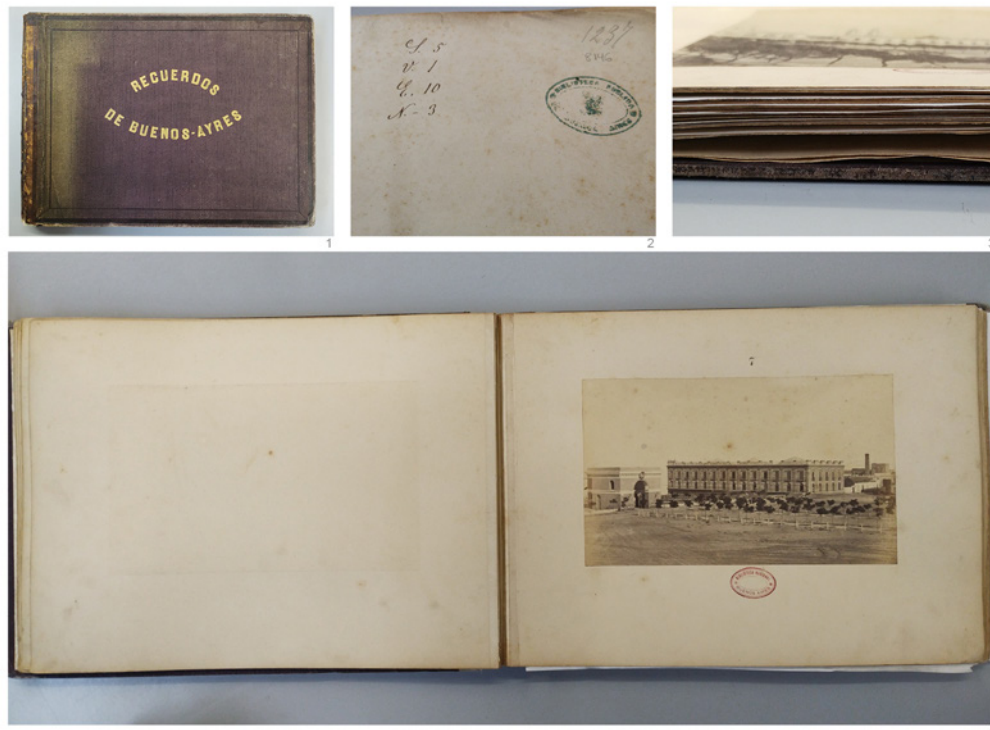
Figure 1. A selection of photographs taken by the author during an in-person visit to the Mariano Moreno National Library in December 2023 from the album by Gonnet, Esteban (1864), Memories from Buenos Aires . Buenos Aires: Fotografía 25 de Mayo . Detail: [1] Gonnet, Esteban (1864). Album cover. Recuerdos de Buenos Ayres . Buenos Aires: Fotografía 25 de Mayo . [2] Detail of topographical inscriptions and stamp of the Buenos Aires Public Library. Gonnet, Esteban (1864) Recuerdos de Buenos Ayres . Buenos Aires: Fotografía 25 de Mayo . [3] Detail of cardstock. Gonnet, Esteban (1864). Memories of Buenos Ayres . Buenos Aires: Fotografía 25 de Mayo . [4] Album spread on albumen print no. 7 with stamp of the National Library of Buenos Aires. Gonnet, Esteban (1864). National Revenue Administration. Memories of Buenos Ayres . Buenos Aires: Fotografía 25 de Mayo .