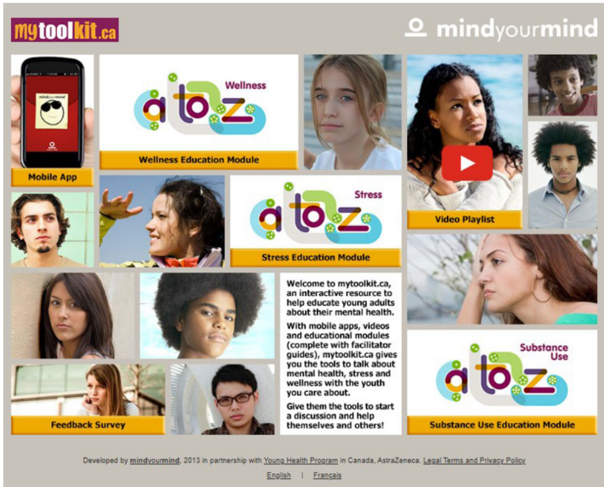
Fig. 2 mytoolkit.ca desde enero 2014 a octubre 2016 (fuente: https://web.archive.org/web/20161022135453/https://mytoolkit.ca/ )

El código QR de la tarjeta de bolsillo, en el que se leía «Desarrollado con YHP Canada» (el Programa