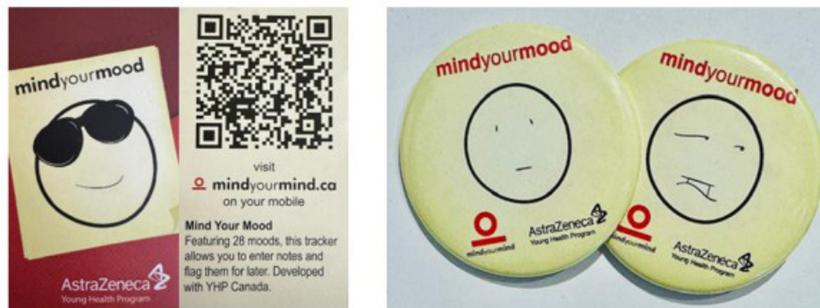
Fig 1. Images of wallet cards and buttons given to mental health conference participants in 2014

This contribution uses visual semiology, following Gillian Rose’s (2023) account of how images make meaning through signs, to analyze how youth mental health artefacts invite youth to track and interpret their moods in ways that can draw them into corporate value circuits. I first analyze the visual design of AstraZeneca-linked artefacts aimed at Ontario-educated youth in 2014 and then compare these with similar artefacts aimed at a broader adolescent audience by 2026. I argue that while AstraZeneca’s visual presence in the artefacts has largely receded over time, these artefacts continue to invite young people to undertake the work of producing psychiatric knowledge about themselves, in what I am calling “psy labour” (Taylor, 2025). This labour can narrow how young people know themselves, while also making their self-knowledge more available for interpretation and intervention within corporate value-generating logics.