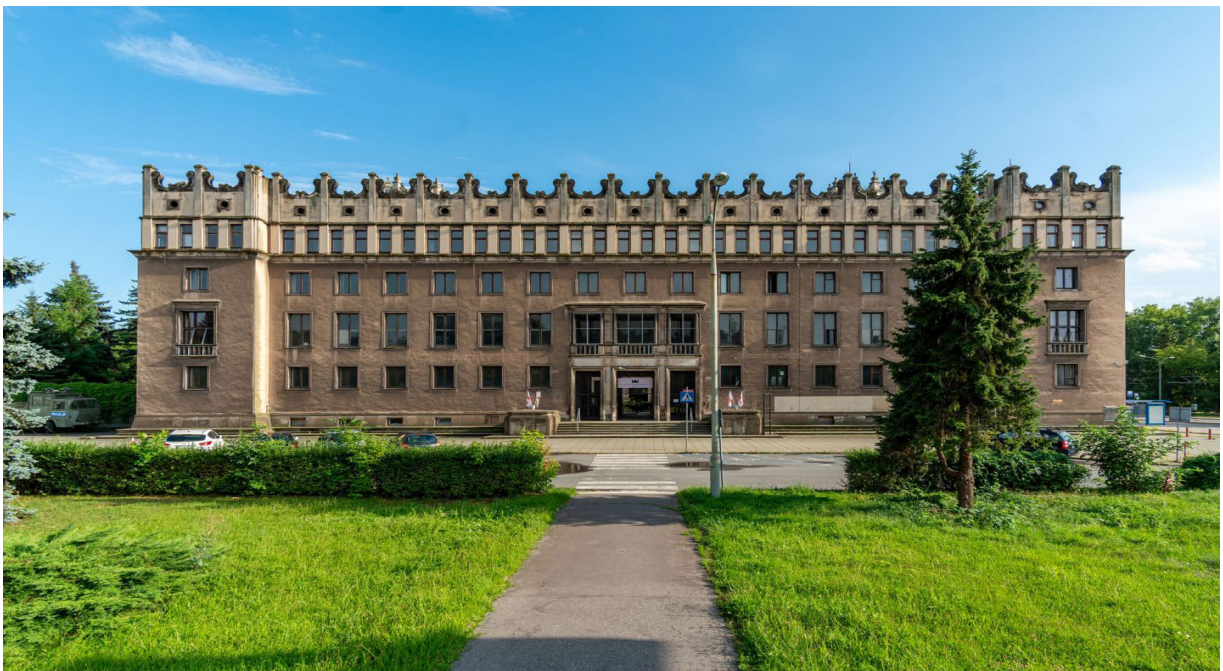
Centro Administrativo Nowa Huta (estado actual)

Empíricamente, este estudio se basa en material generado como parte del proyecto de investigación internacional denominado UNLOCK6 y se enfoca en tres estudios de caso en Cracovia: el Hotel Cracovia, el Centro Administrativo Nowa Huta y el Museo de Nowa Huta. 7 Estos sitios se seleccionaron por su vinculación con el poder del estado socialista, por su estatus controversial en el discurso público y por su potencial para ser transformados a través de un nuevo uso adaptativo.