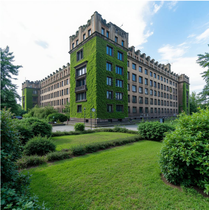
Transformación especulativa generada con inteligencia artificial del Centro Administrativo Nowa Huta. Generada con un modelo personalizado a través de Flux Dev.

Se realizaron 24 entrevistas cualitativas con residentes de edades diferentes, así como con arquitectos, curadores conservacionistas y profesionales de museo. Se les mostró a los participantes visualizaciones generadas con inteligencia artificial que presentaban futuros posibles (de uso) para sitios como el Hotel Cracovia y el Centro Administrativo Nowa Huta Administrative. Estas imágenes no fueron tomadas como diseños finales sino como un estímulo para estimular la imaginación, la respuesta emocional y una reflexión sobre posibles transformaciones (Reason & Bradbury, 2008).