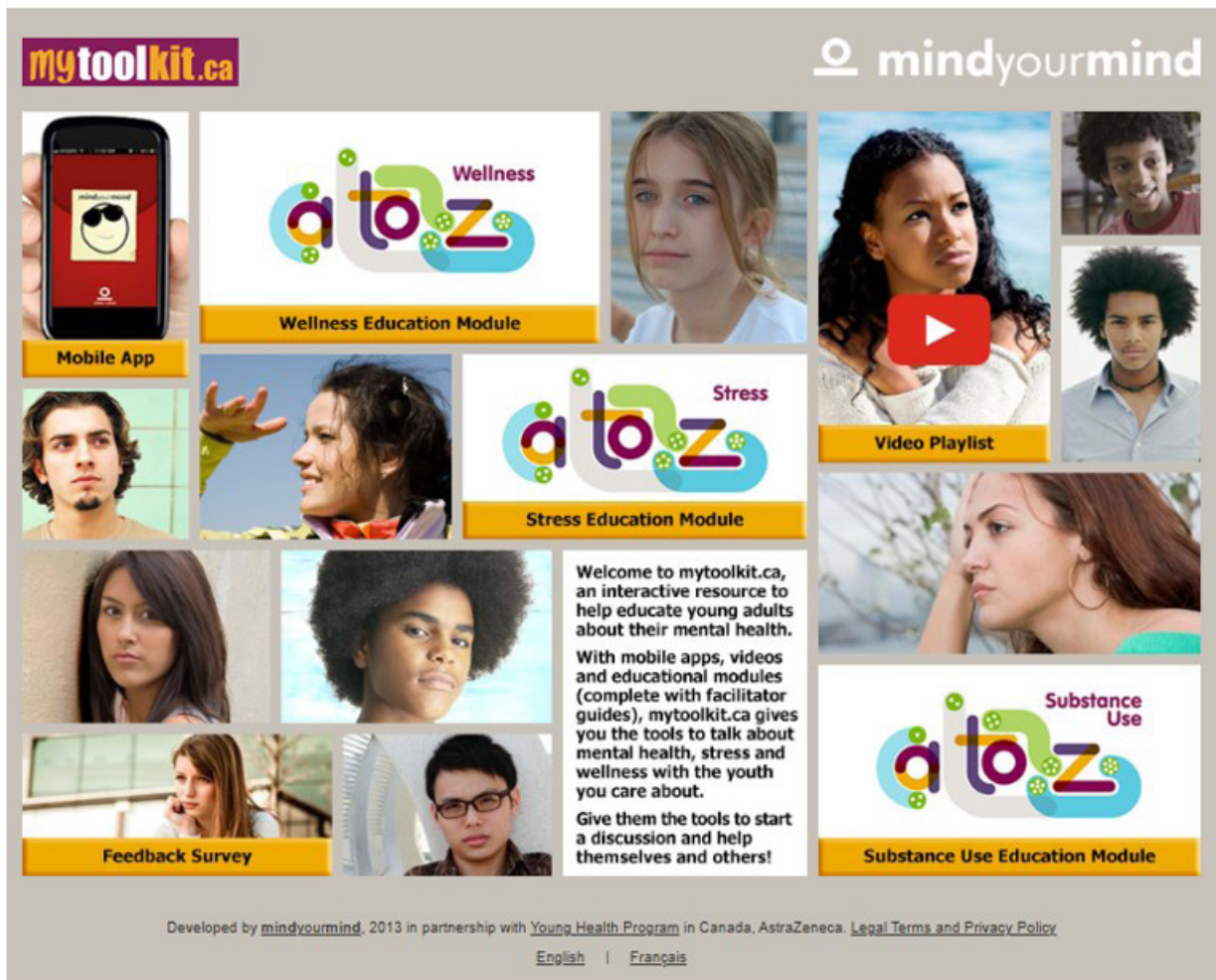
Fig.2 mytoolkit.ca from Jan. 2014 to Oct. 2016 (source: retrieved from https://web.archive.org/web/20161022135453/https://mytoolkit.ca/ )

paired with cartoon facial expressions identical to those depicted on the buttons. The app encouraged users to track and digitally document their moods over time. On mytoolkit.ca, practices of noticing, tracking, and interpreting moods were encouraged within youth-friendly clickable tiles, which were visually anchored through mytoolkit.ca logo colour choices and phrasing evocative of AstraZeneca: “a to z Wellness,” “a to z Stress” and “a to z Substance Use” (mindyourmind, n.d.-b; see also Figure 2 top left and AstraZeneca, n.d.-a). In tiny print, it reads, “...in partnership with Young Health Program in Canada. AstraZeneca.”