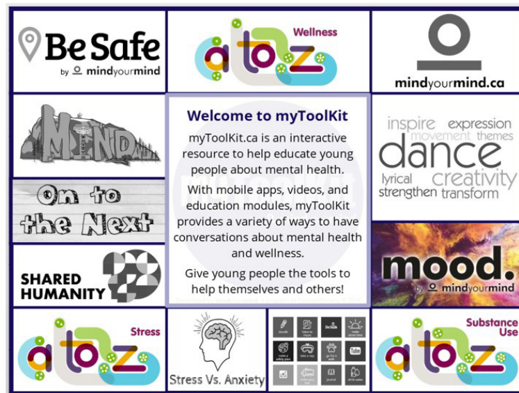
Fig 3. mytoolkit.ca en 2026

Partiendo de la abreviatura «psy» propuesta por de Nikolas Rose (1989, pp. viii–x) y de la descripción de Morini y Fumagalli (2010) del «biolabor» inmaterial, describo esto como «psy labor» (labor o trabajo psy) porque exige a los y las jóvenes que dediquen trabajo cognitivo y afectivo inmaterial no remunerado para producir autoconocimiento en formas reconocibles desde el punto de vista psiquiátrico, de las que las empresas pueden beneficiarse. El paso de los artefactos de la marca AstraZeneca a la legitimidad sancionada por el gobierno hace que el trabajo psy parezca ordinario y rutinario, casi banal. La aplicación es ahora personalizable, lo que intensifica la implicación, mientras que la presencia significativa de los trastornos psiquiátricos del DSM-5-TR en el sitio web ofrece a los usuarios marcos a través de los cuales sus estados de ánimo pueden clasificarse y reconocerse como síntomas. Estos representan invitaciones más sutiles a realizar trabajo psy que cultivan formas personalizadas y organizadas psiquiátricamente de comprender los propios estados de ánimo. El producto final del trabajo psi es la legibilidad psiquiátrica, y los beneficios corporativos no se obtienen únicamente a través de la marca directa, sino porque la autocomprensión de los y las jóvenes se vuelve cada vez más accesible y abierta a la clasificación y derivación psiquiátricas y, por lo tanto, potencialmente explotable como objeto de acumulación dentro de los circuitos de valor corporativos.