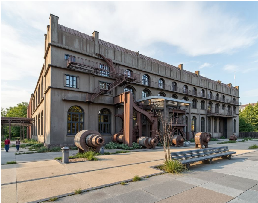
Alternative AI visualization of the site showing potential adaptive reuse.

but redistributes it - inviting users to co-create meanings based on their experiences and values.