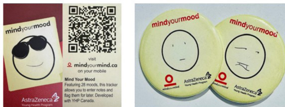
Fig. 1. Imágenes de las tarjetas de bolsillo y los pines que se entregaron a los/as participantes en la conferencia sobre salud mental celebrada en 2014

Esta contribución recurre a la semiótica visual —siguiendo la explicación de Gillian Rose (2023) sobre cómo las imágenes crean significado a través de los signos— para analizar cómo los materiales sobre salud mental dirigidos a los y las jóvenes les invitan a realizar un seguimiento e interpretación de sus estados de ánimo de formas que pueden incorporarlos a los circuitos de valor corporativos. En primer lugar, analizo el diseño visual de los artefactos vinculados a AstraZeneca dirigidos a jóvenes en Ontario en 2014 y, a continuación, los comparo con artefactos similares dirigidos a un público adolescente más amplio en 2026. Sostengo que, si bien la presencia visual de AstraZeneca en los artefactos ha disminuido en gran medida con el tiempo, estos artefactos siguen invitando a los y las jóvenes a emprender la tarea de producir conocimiento psiquiátrico sobre sí mismos, en lo que denomino «trabajo psi» (Taylor, 2025). Este trabajo puede limitar la forma en que los jóvenes se conocen a sí mismos, al tiempo que hace que su autoconocimiento sea más susceptible de interpretación e intervención dentro de las lógicas corporativas de generación de valor.