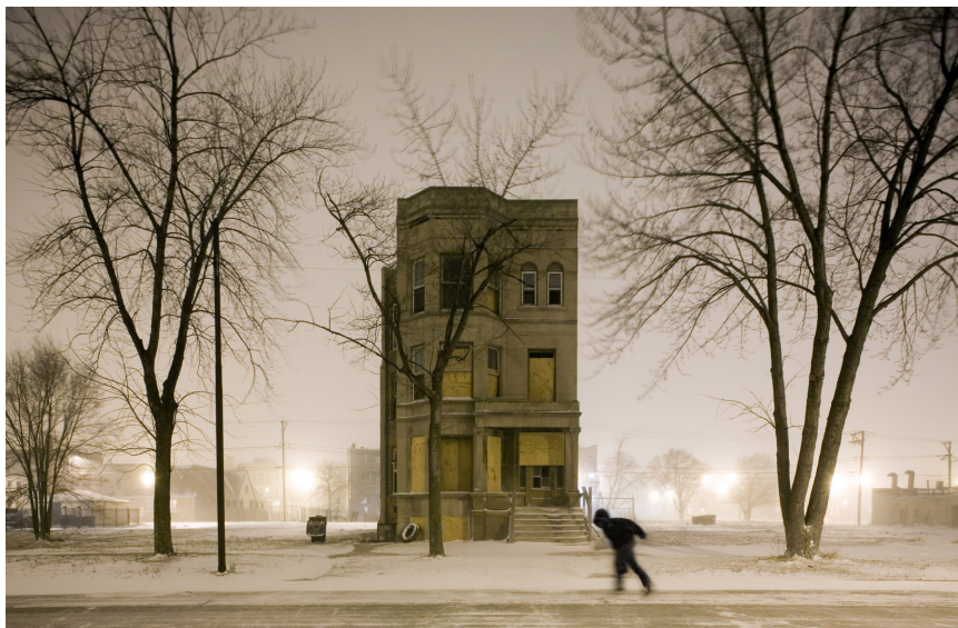
Image Credits: Paweł Starzec – Heliodrom, Mostar, 2017, from Makeshift series

Maike Pötschulat, one of the exhibition's curators said: 'Absence is not emptiness. Often what appears to be absent can have a large footprint in our lives and societies while generating a whole host of activities. In this exhibition we wanted to focus on the ways in which absence is lived, felt and practiced to show what materialises in the gaps and voids that are left by an absence.'