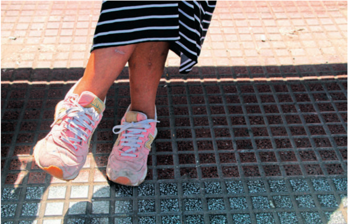
Imagen de contratapa/Back Cover Image: by Mariana Lifschitz, Descanso. Esta foto fue tomada en Villa Devoto, Ciudad de Buenos Aires - Argentina. Se tomó en el marco de una nota periodística sobre el Centro Integral de la Mujer María Gallego que realiza una intensa labor territorial atendiendo casos de violencia doméstica y capacitaciones en escuelas y en la Comuna.

Back cover image by Mariana Lifschitz, Rest. This photo was taken in Villa Devoto, Buenos Aires, Argentina. It was taken for a newspaper article on the María Gallego Comprehensive Women's Centre's intensive neighbourhood work attending cases of domestic abuse and provision of training sessions in schools and municipality.